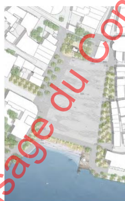
La Place du Maché - Vevey

11'320'000.- n.a. n.a. 6250 m 2 1811.- CHF/m 2 TTC n.a.