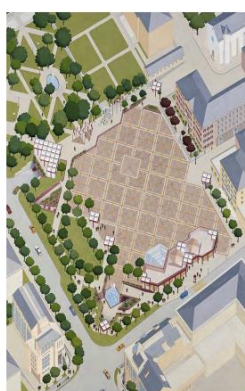
La Planta 1989

Des comparaisons ont été établies avec d'autres projets semblables :