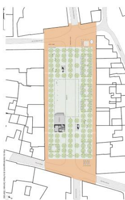
La Place Centrale - Martigny

11'670'000.- 7'060'000.- 4'620'000.- 9664 m 2 1057.- CHF/m 2 TTC 639.- CHF/m 2 TTC