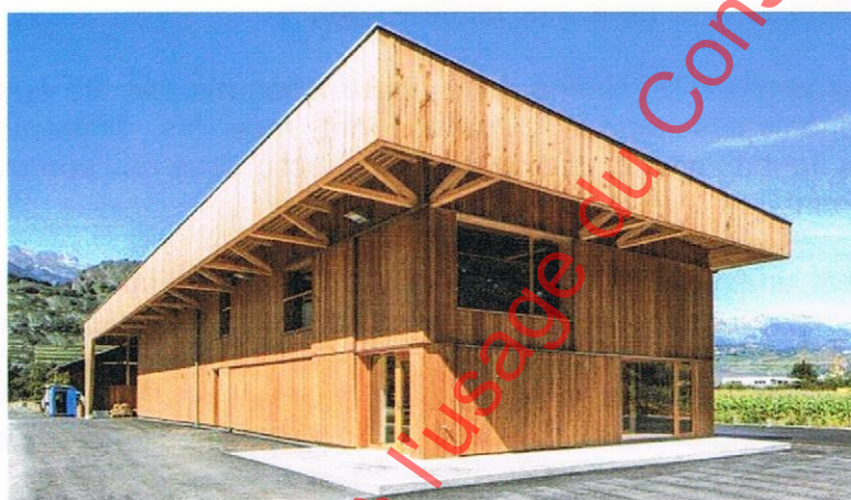
« Cône de Thyon »

Nous pouvons d'ailleurs relever des réalisations intéressantes utilisant du bois valaisan dans la schématique proposée telles que la Passerelle de la Borgne, l'Atole de la Planta, le bâtiment du Cône de Thyon, le projet du dépôt Oiken à Sierre (8'500m 3 soit 7'650 tonnes de CO 2 ), les façades du parking de l'Hôpital... Ces différentes exécutions démontrent que cette économie circulaire n'est pas utopique, mais reflète uniquement la nécessité d'une volonté politique.