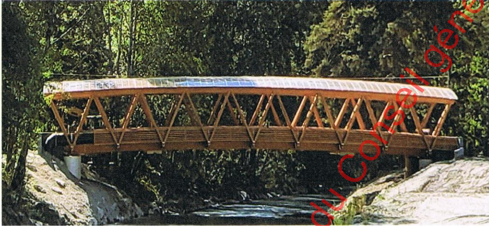
« Passerelle de la Borgne »