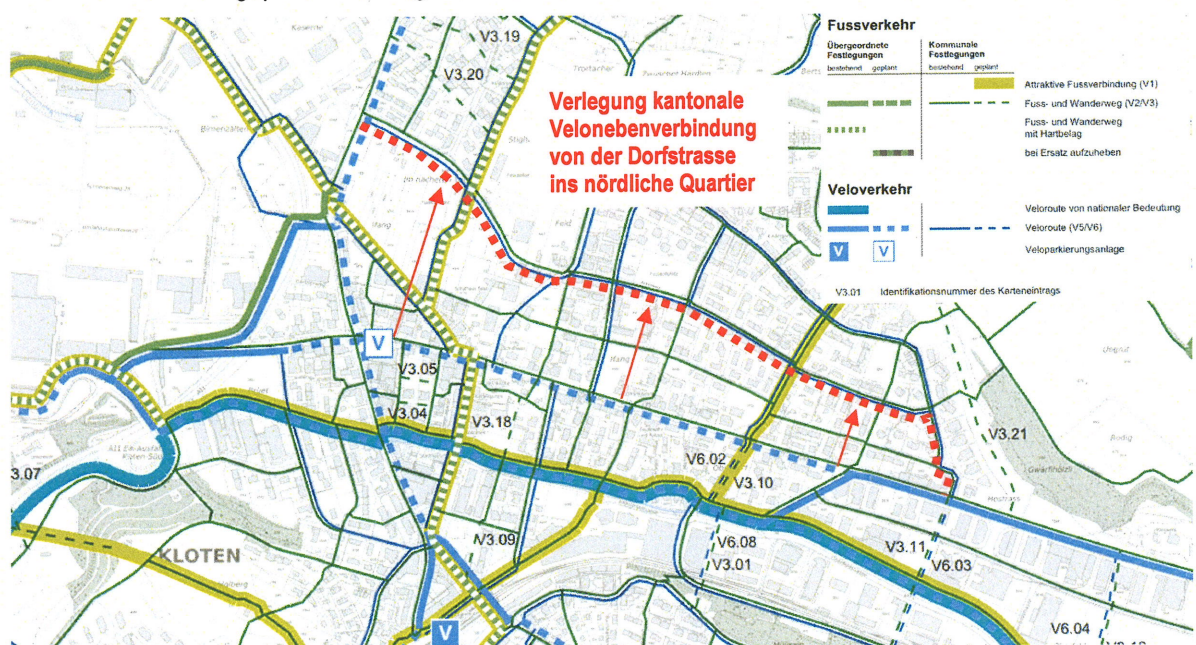
Abb. 3: Kommunale Richtplanvorlage 2023/24, Kartenausschnitt Fuss- und Veloverkehr

Die Planungsvorlage zur Revision des kommunalen Richtplans (abgelehnt an der Urne am 24.11.2024) zeigt das bestehende und geplante Velowegnetz in Kloten auf.