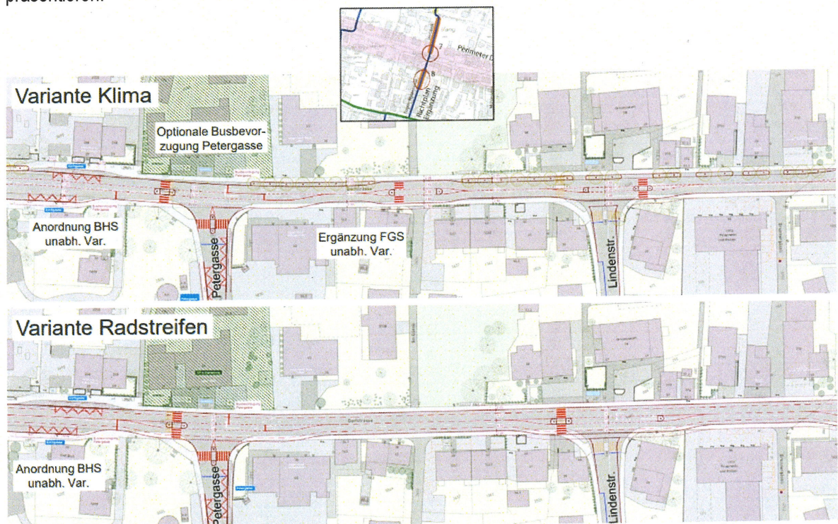
Abb. 2: Planausschnitte der Grundsatzvarianten «Radstreifen» und «Klima», Betriebs- und Gestaltungskonzept Dorfstrasse

Im Rahmen der Erarbeitung des Betriebs- und Gestaltungskonzept Dorfstrasse liegen nun die beiden folgenden Grundsatzvarianten «Radstreifen» und «Klima» vor. Im folgenden Planausschnitt ist exemplarisch für den ganzen Projektperimeter aufgezeigt, wie sich die räumlichen Verhältnisse und die Gestaltung in beiden Varianten präsentieren.