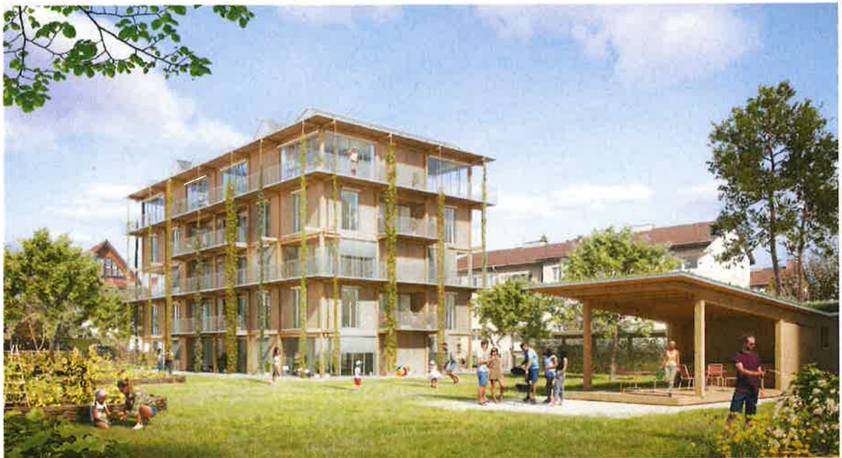
Abb. 2: Visualisierung Richtprojekt mit Pavillongebäude

Das Richtprojekt reiht sich mit seinem Volumen in die Bebauungsstruktur am Ewigen Wegli ein, die durchgehend zur Strasse längsorientierte Baukörper aufweist. Die Abmessungen des eingefügten neuen Baukörpers sind vergleichbar mit denjenigen der Nachbarbauten. Das bestehende Pavillongebäude begrenzt den Aussenraum auf der Ostseite. Es enthält eine Studiowohnung, ein Aussenlager und einen gedeckten Sitzplatz mit Aussenküche. Es ist zur Wiese hin orientiert und ist ein Ort gemeinschaftlicher Begegnung. Der neue fünfgeschossige Bau wird über einen nordseitigen Laubengang erschlossen. Die Wohnungen befinden sich in den ersten vier Geschossen. Es sind Familien- und Clusterwohnungen vorgesehen. Das fünfte Geschoss hat einen gemeinschaftlich bespielbaren Raum, der sich für eine Vielzahl von möglichen Nutzungen eignet. Der Aussenraum wird von den Bewohnenden bewirtschaftet und mitgestaltet. Das Ziel ist der Anbau und die Pflege von Gemüse, Kräutern, Obst und Blumen in einem Gemeinschaftsgarten.