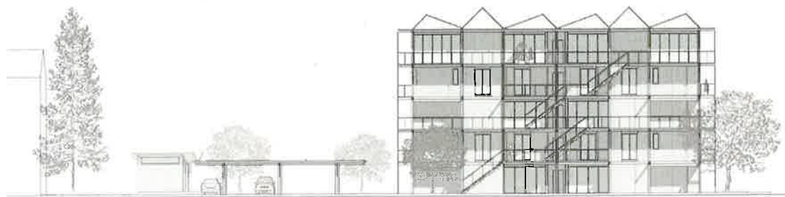
Abb. 3: Richtprojekt, Ansicht Nord