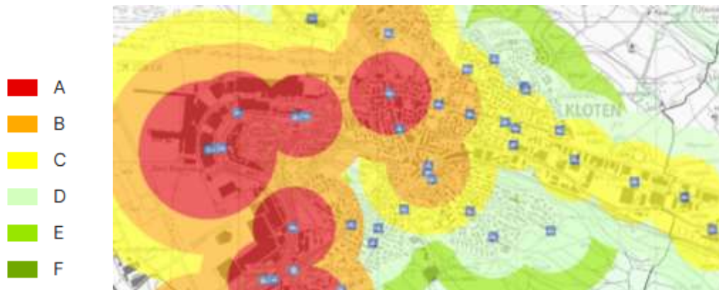
Abb. 1: Plan der ÖV-Güteklassen (Quelle: www.geo.zh.ch , abgerufen am 17.09.2025)

Das Quartier Buchhalden befindet sich in den Güteklassen C und D, was einer mittleren Erschliessungsqualität entspricht. Mit der Einführung des Viertelstundentakts der S-Bahn (S7) am Bahnhof Kloten wird sich die Erschliessungsqualität auch im Quartier Buchhalden verbessern.