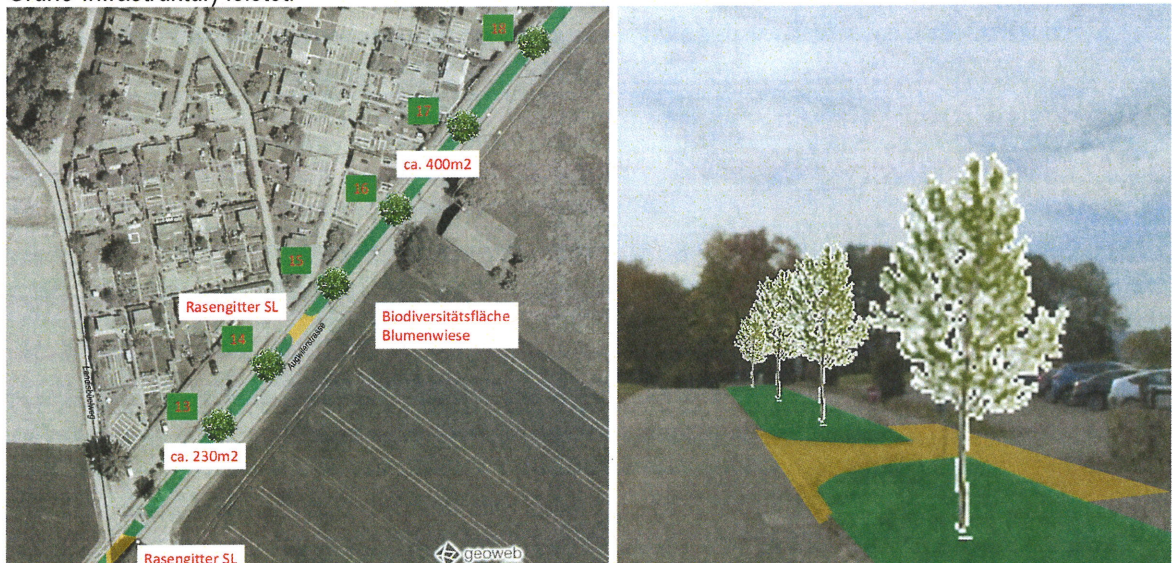
Abb: Ausschnitt aus Massnahmeplan Augwilerstrasse

Die bestehenden Überfahren in die Flurstrassen und Parkplätze ab der Augwilerstrasse werden örtlich saniert. Die vorhandenen Strassenabschlüsse und die bituminösen Beläge auf dem Geh-/Radweg sowie zwischen der Strasse und Hinterkante Geh-/Radweg sind zu ersetzen. Die Fläche zwischen dem besagten Geh-/Radweg und der Strasse im Bereich der Überfahrten wird ersetzt und durch einen sogenannten Rasenliner begrünt. Ein Rasenliner ist ein Betonverbundstein, welcher Überfahrten und Nutzungen mit höheren Belastungen zulässt, im Gegenzug aber infolge der Begrünung seinen Beitrag zur Hitzeminderung und Versickerungsmöglichkeit (Blau-Grüne-Infrastruktur) leistet.