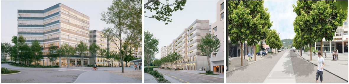
Bilder links / Mitte: Richtprojekt für Neubauten an der Schaffhauserstrasse 115 bis 121, Armon Semadeni Architekten Gmbh / Allreal AG