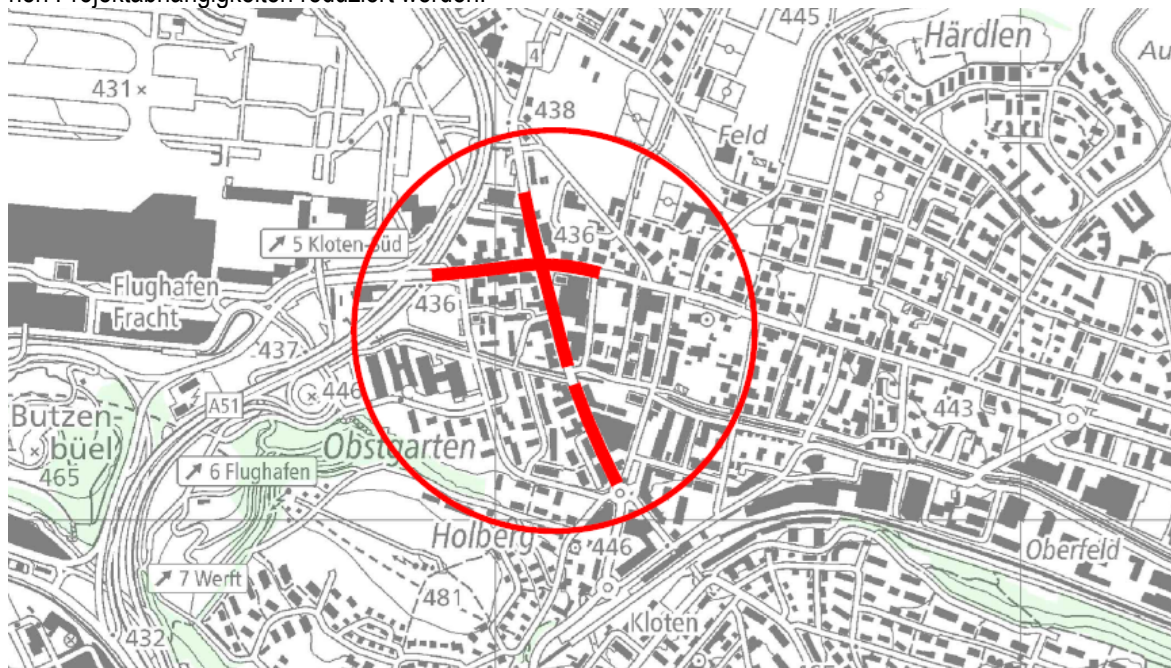
Abbildung 1: Perimeter des Betriebs- und Gestaltungskonzeptes Schaffhauserstrasse

Aus diesem Grund lancierte der Kanton bereits 2016 ein Betriebs- und Gestaltungskonzept, welches in enger Zusammenarbeit mit der Stadt Kloten entwickelt wurde. Dieses umfasst die Schaffhauser-, Flughafen- und Dorfstrasse, die allesamt Kantonsstrassen sind. Im Zusammenhang mit der Projektierung der Glattalbahnverlängerung wurde 2019 entschieden, dass der Projektabschnitt bei der Altbachbrücke / Kreuzung Bachstrasse im Rahmen des Glattalbahnprojektes geplant und umgesetzt wird (Abbildung 1: ausgesparter Teil). Damit können Projektabhängigkeiten reduziert werden.