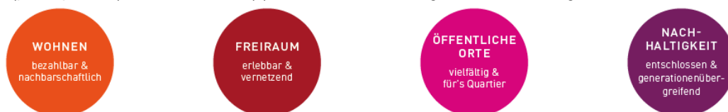
Abbildung: angestrebte Leistungen der Überbauung Chasern (Lei(s)tbild zur Entwicklung Chasern, 2021)

Die (partizipativen) Arbeiten am Lei(s)tbild hat diese Haltung auch klar bestätigt.