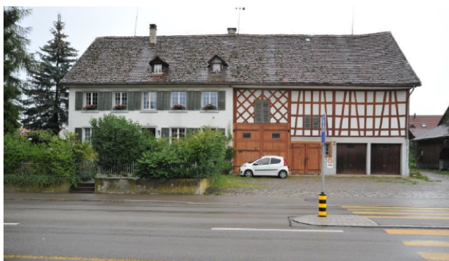
Abbildung 2: Südansicht des Bestandesgebäudes Dorfstrasse 43

Weitere Rahmenbedingungen des Grundstücks sind folgende: