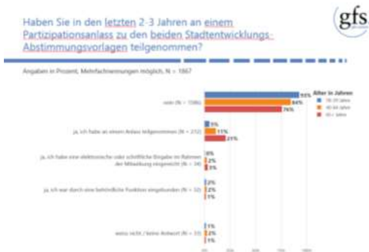
Abbildung 2: Teilnahme an einem Partizipationsanlass zu den Stadtentwicklungsvorlagen, aufgeschlüsselt nach Alterskategorien.

Dennoch haben 80% der Befragten angegeben, dass sie gerne stärker in die Ausarbeitung von wichtigen Vorlagen eingebunden würden.