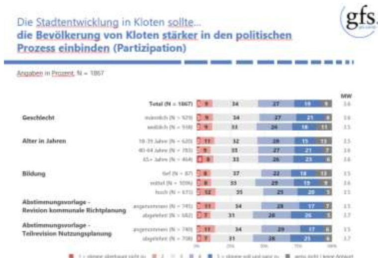
Abbildung 3: Wunsch der Befragten, dass sie stärker in den politischen Prozess eingebunden werden