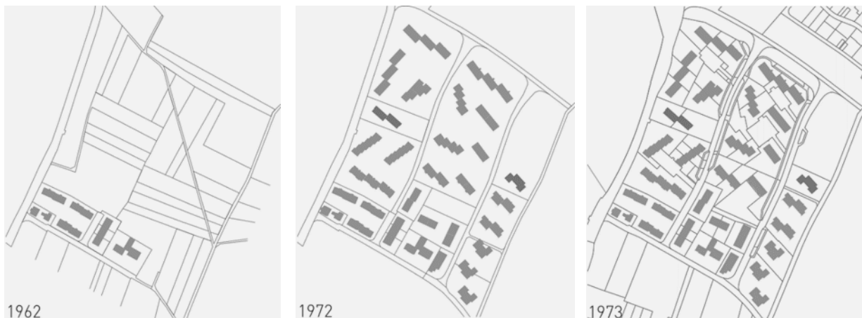
Abbildung 1: Geschichtliche Entwicklung des Hohrainlis (v.l.n.r. Jahr: 1962, 1972 und 1973) (Darstellung: yellow z)

Die Eröffnung des Flughafens im Jahre 1953 prägt die Entwicklung der Stadt Kloten bis heute. Das Gebiet Hohrainli wurde im Zusammenhang mit der Flughafenentwicklung und in enger Zusammenarbeit mit den Eigentümerschaften konzipiert und überbaut. Die Grundeigentümergebietordnung und der Richtplan Hohrainli gehen zurück auf das Jahr 1963. Die Mehrheit der Gebäude entstand im Zeitraum von 1965 bis 1973. Das Quartier Hohrainli ist mit zwei- bis sechsgeschossigen Mehrfamilienhäusern in einer Zeilenbauweise überbaut. Der Richtplan aus dem Jahre 1963 widerspiegelt ein städtebauliches Leitbild der «gegliederten und aufgelockerten Stadt». Durch die charakteristische gemischte Bauweise entstand im Hohrainli eine bis heute wertgeschätzte Stadtlandschaft. Gruppierete, in Höhe und Länge gestaffelten Zeilen- und Punktbauten besetzen das Terrain so, dass der Landschaftsraum das gesamte Gebiet gleichsam «durchfließt».