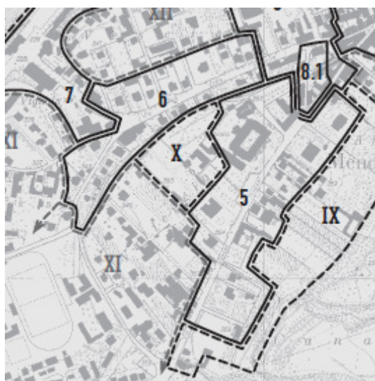
ISOS: Perimetri edificati (P) 5 (via Turconi) e 6 (via Motta - Via Franchini)