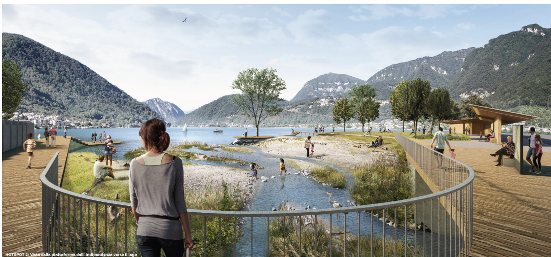
Concorso di rivalorizzazione del Laveggio: Hot spot 2 – foce (Studio Vulkan, Zurigo)

In zona Foce è prevista la realizzazione dell'Hot spot 2 con un'accezione di tipo più urbano. Qui è prevista la realizzazione di passerelle e l'inserimento di nuove componenti di svago. I nuovi elementi costruiti permetteranno di valorizzare lo spazio nel rispetto dell'ambiente naturale e del paesaggio circostante e di migliorare la fruizione pubblica delle rive.