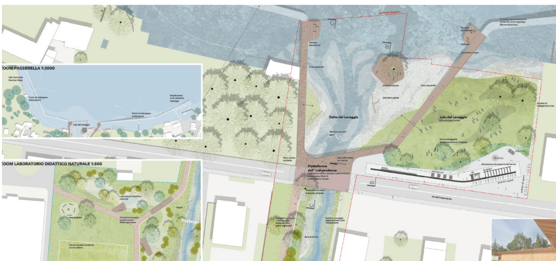
Concorso di rivalorizzazione del Laveggio: Hot spot 2 - foce (Studio Vulkan, Zurigo)

In prossimità della zona di intersezione del fiume Laveggio con Via Motta, il progetto prevede di ampliare la sezione del corso d'acqua per realizzare l'Hot spot 1, di carattere prevalentemente naturale, che permetterà di rinaturalizzare i profili fluviali, di creare dei piacevoli passaggi fra sponde e greto e di garantire una generosa accessibilità all'alveo, grazie alla presenza di piattaforme di collegamento in legno.