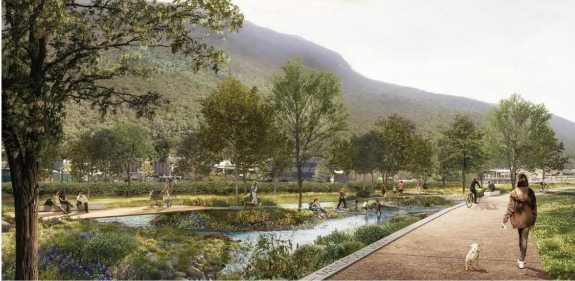
Concorso di rivalorizzazione del Laveggio: Hot spot 1 - prossimità dell'intersezione del fiume Laveggio con Via Motta (Studio Vulkan, Zurigo)

Il concorso d'idee con procedura selettiva ha dunque permesso di disporre di una proposta di intervento valida che soddisfa tutti gli obiettivi richiesti dagli enti banditori (Comune di Riva San Vitale, Città di Mendrisio e Consorzio Manutenzione Arginature Medio Mendrisiotto) ponendo di fatto le basi per proseguire con gli sviluppi di questo importante progetto.