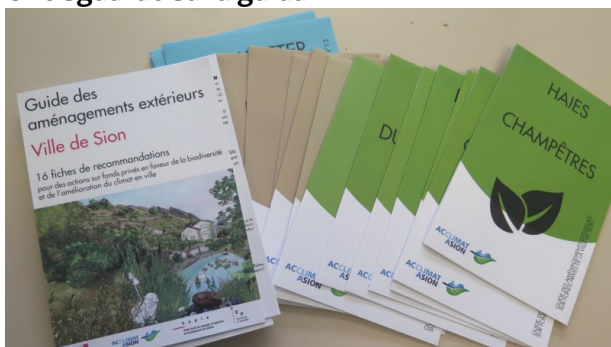
Copertina della guida di Sion

La città di Sion ha tradotto il suo grande progetto e le preziose conoscenze acquisite anche in una guida molto accattivante, semplice da consultare. Uno strumento pedagogico destinato anche al pubblico.