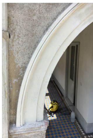
Figura 2: arco dopo il restauro