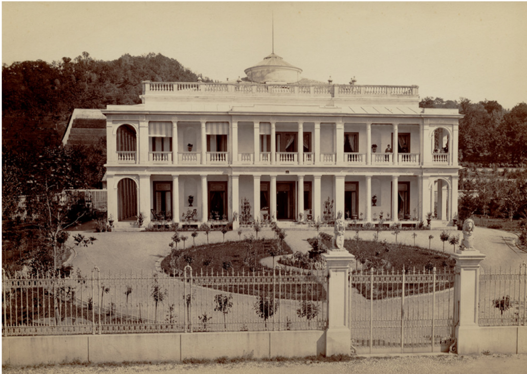
Figura 4: Vista del fronte principale, 1900 ca., Archivio Gino Macconi.