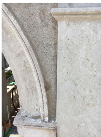
Figura 1: arco prima del restauro