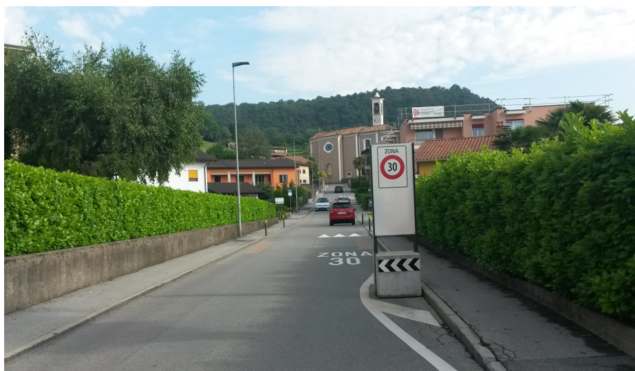
Zona 30 Rancate – Comparto Nucleo