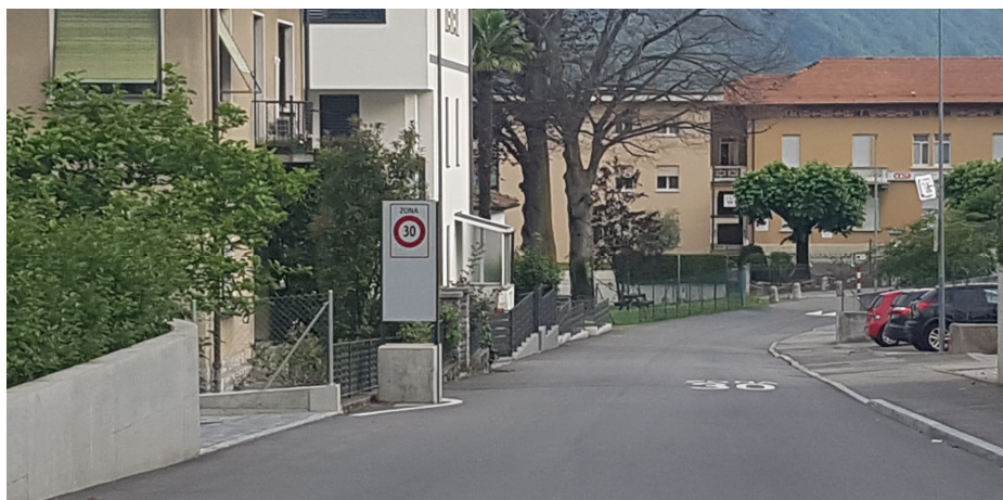
Zona 30 Mendrisio - Comparto Cimitero