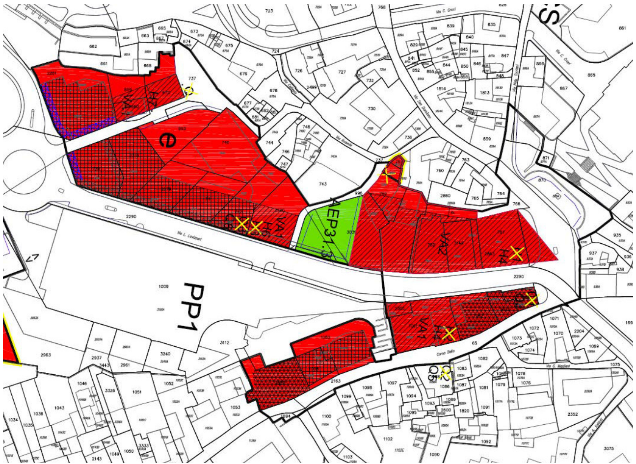
Perimetro comparto speciale Piazza del Ponte (Rapporto di pianificazione, 2015)