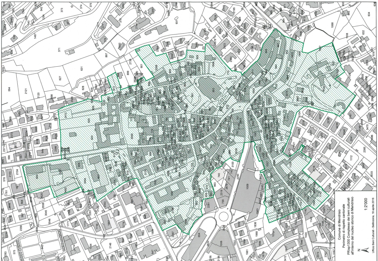
Perimetro di rispetto cantonale - Complesso dei beni culturali all'interno del nucleo storico