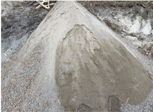
f1 = [0-10] mm -> esente da rizomi vitali