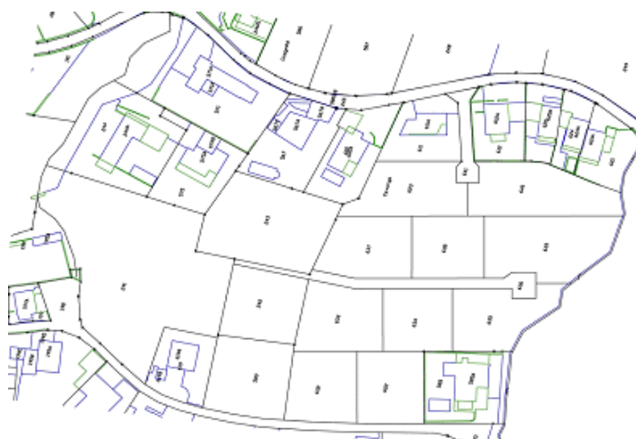
Estratto mappa catastale

Per un'attenta analisi del progetto vanno tenuti in considerazioni diversi aspetti, di carattere pianificatorio, tecnico e finanziario.