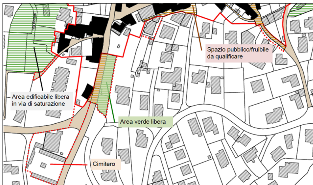
Figura 3: il perimetro meridionale è ampliato fino a includere il cimitero