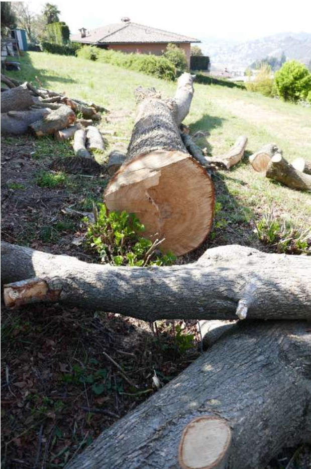
A4. Abbattimento di un grande e sano Liquidambar a Davesco