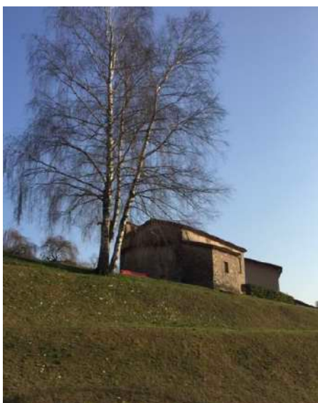
B2. Il colpo d’occhio prima della frutta