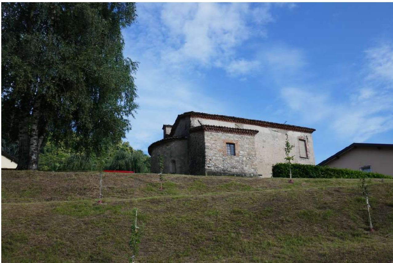
B1 – Alcuni alberi da frutta piantati in primavera. Fra un paio d’anni le fronde copriranno parzialmente la vista della chiesuola dei SS. Pietro e Paolo di Orlino.