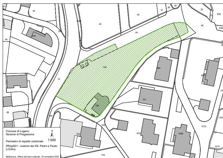
B3. In verde il perimetro di rispetto cantonale