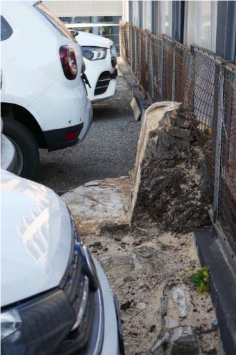
A2. Quel che resta del pioppo di via Balestra