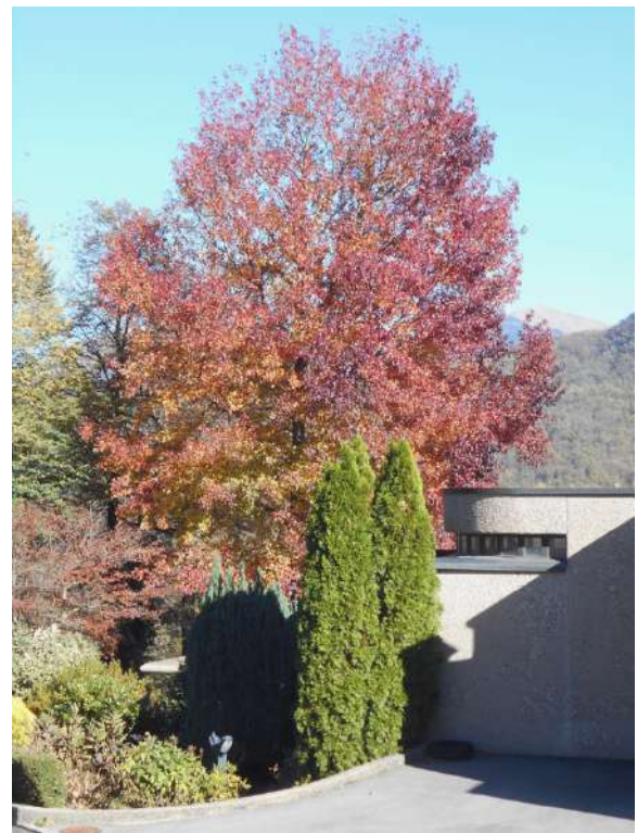
A5. Il Liquidambar vivo, in veste autunnale