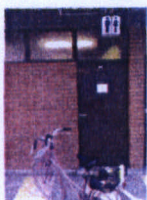
WC a Viganello (con luce accesa anche di giorno)