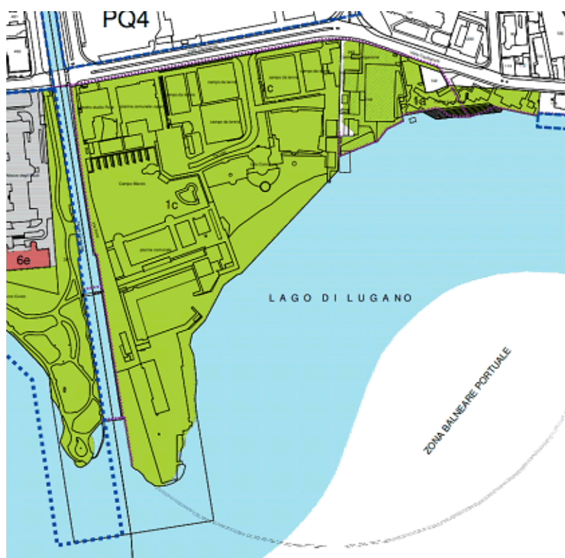
Estratto del Piano delle attrezzature ed edifici d'interesse pubblico

Lo stesso comparto è poi interessato dal “Comprensorio di protezione della riva del lago”, oggetto di una variante di Piano regolatore in adeguamento all’art. 41b dell’Ordinanza sulla protezione delle acque che mira a salvaguardare e valorizzare tutti gli aspetti caratteristici e di pregio dell’ambiente lacuale. L’assetto pianificatorio attuale non impedisce di concretizzare gli intendimenti del Masterplan, nella misura in cui non ostacola lo spostamento dei posteggi a Campo Marzio Nord, la creazione di un nuovo percorso pedonale est-ovest, oppure la riorganizzazione degli spazi. Allo stesso tempo la pianificazione in vigore non impone nemmeno la realizzazione di nuove infrastrutture che potrebbero compromettere gli obiettivi sopra citati. Per la proprietà della Società Navigazione del Lago di Lugano va tuttavia fatto un discorso a parte, nel senso che la necessità di una variante di Piano regolatore potrà essere valutata quando la stessa Società disporrà di un quadro più completo delle sue intenzioni a medio e lungo termine.