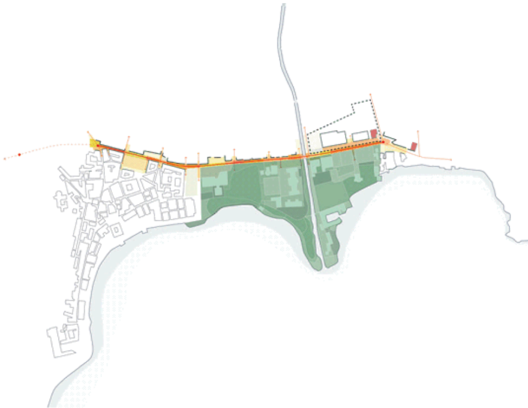
Concetto di parco comprensivo del Parco Ciani, della foce e del Campo Marzio Sud così come illustrato dal masterplan Campo Marzio Nord