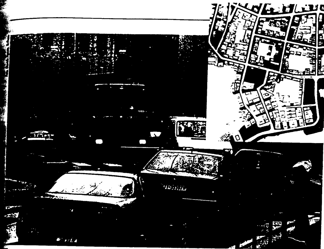
Troppo rumore. Troppi gas tossici. L'inquinamento a Lugano supera i limiti legali. Molti abitanti rischiano bronchite, asma e cancro. Nel riquadro: una delle cartine che le autorità hanno nascosto all'opinione pubblica su pressione delle lobby economiche. In rosso: le zone ad alto inquinamento fonico dove sarebbero indispensabili misure di risanamento.

Per questo motivo anche la terza perizia è stata nascosta all'opinione pubblica.