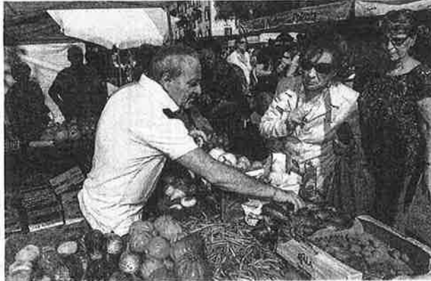
Il plenone all'inaugurazione del nuovo mercato, nel 2013.