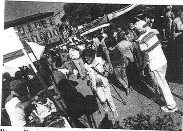
Un progetto per riportare la gente tra le bancarelle.

tivo? Dare a cittadini e turisti la possibilità di vivere (e riscoprire) un «vero e ampio mercato». Ma nel progetto non si parla soltanto di unione ma anche di spostamento: le bancarelle dovrebbero essere distribuite, secondo la promotrice, tra Piazza San Rocco e Piazza della Riforma. Tra le richieste c'è quindi quella di abbandonare Piazza del Mercato, che stenterebbe a decollare. E la gestione dell'evento sarebbe inoltre da affidare al Comune. P.A.ST.