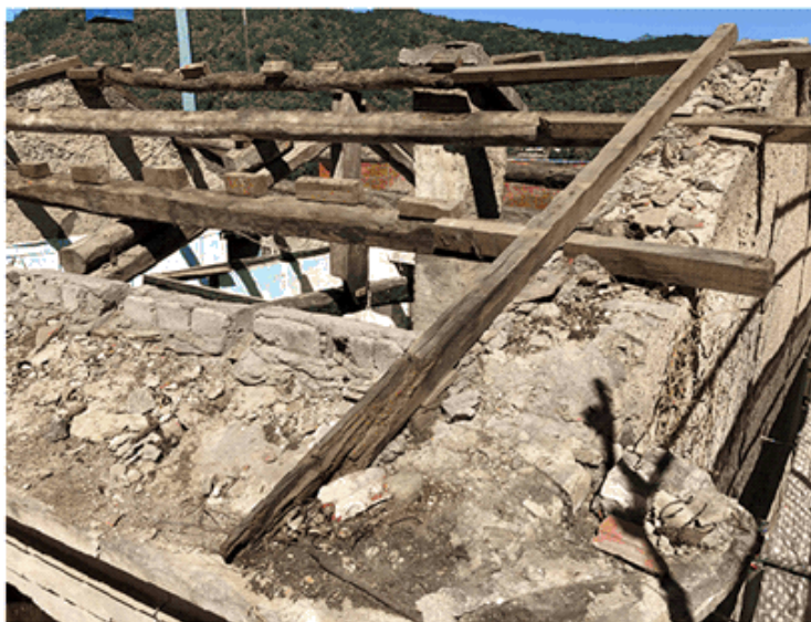
Situazione durante lavori di sistemazione del tetto (luglio 2021)

Si condivide dunque la visione dei mozionanti della necessità di rivalorizzare la Masseria che, con l'intervento di rifacimento del tetto, è stata conservata al fine di limitarne il deperimento proprio in vista di un possibile riutilizzo.