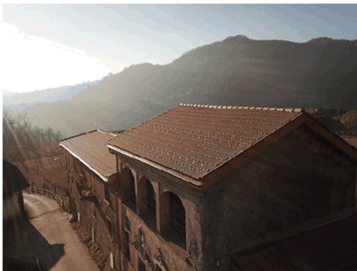
Situazione dopo i lavori di sistemazione del tetto (dicembre 2021)