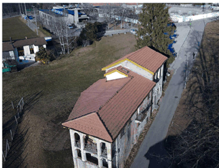
Situazione dopo i lavori di sistemazione del tetto (dicembre 2021)

Per questo motivo, con risoluzione municipale del 17 dicembre 2020, il Municipio ha preso atto dell'interesse del Cantone per lo sviluppo di un progetto congiunto e sono stati avviati approfondimenti per la definizione dei possibili contenuti, prendendo come spunto di partenza i principi di mantenimento del carattere agricolo del sedime, cercando però una connotazione prioritariamente pubblica e formativa. È stato quindi contattato il Dipartimento dell'Educazione della cultura e dello sport e verificato l'interesse della Sezione della pedagogia speciale della Divisione della scuola. Successivamente è stato istituito un gruppo di lavoro, al fine di sviluppare un'ipotesi di riconversione.