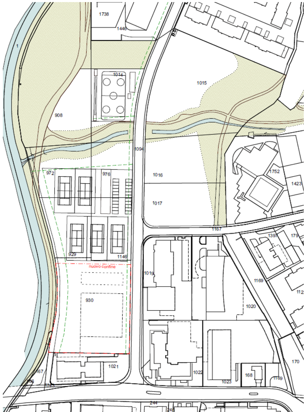
Verifica di grande massima delle potenzialità per la sistemazione futura della zona AP8