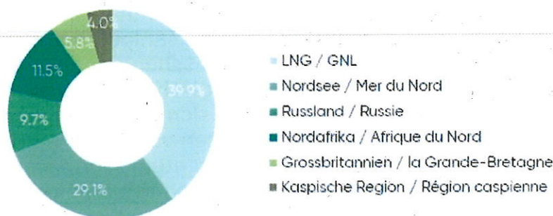
Fig-5a Import-Portfolio der EU Mitgliedstaaten 2023 Portefeuille des importations des pays membres de l'UE 2023

* Aufgrund der Veränderungen an den europäischen Gashandelsmärkten, auf denen die schweizerischen Gasversorger ihre Gasmengen kontrahieren, ist eine belastbare länderspezifische Darstellung nicht mehr möglich.