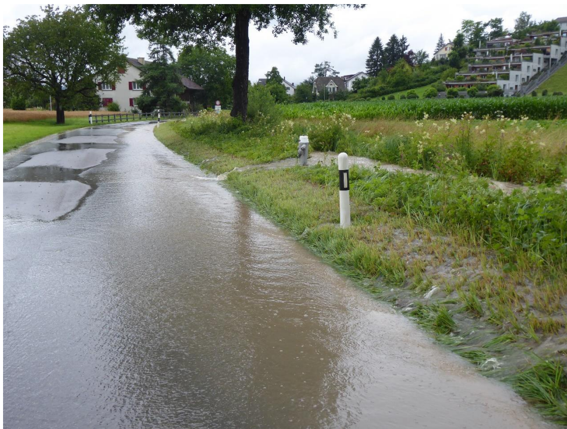
Hochwasserereignis vom 13. Juli 2021

In der Regel werden die Kantonsstrassen im Kanton Aargau, sofern das Kosten-Nutzen-Verhältnis und die Machbarkeit gegeben sind, bis zu einem HQ 100 vollkommen geschützt. Nach dem Variantenstudium für verschiedene Schutzziele wurde an der Projektsitzung vom 24. Mai 2018 festgelegt, den Hochwasserschutz der Kantonsstrasse bei Abflüssen \leq HQ 30 (= Hochwasserereignis, welches statistisch gesehen alle 30 Jahre einmal stattfindet) gemäss Nettoprinzip zu gewährleisten. Damit liegt das gewählte Schutzziel für die Ammerswilerstrasse unter dem bei anderen Kantonsstrassen oft erreichten und angestrebten Schutzziel HQ 100 .