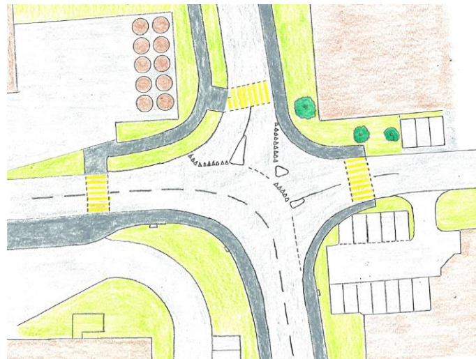
Lösung Knoten Hardstrasse / Fabrikstrasse