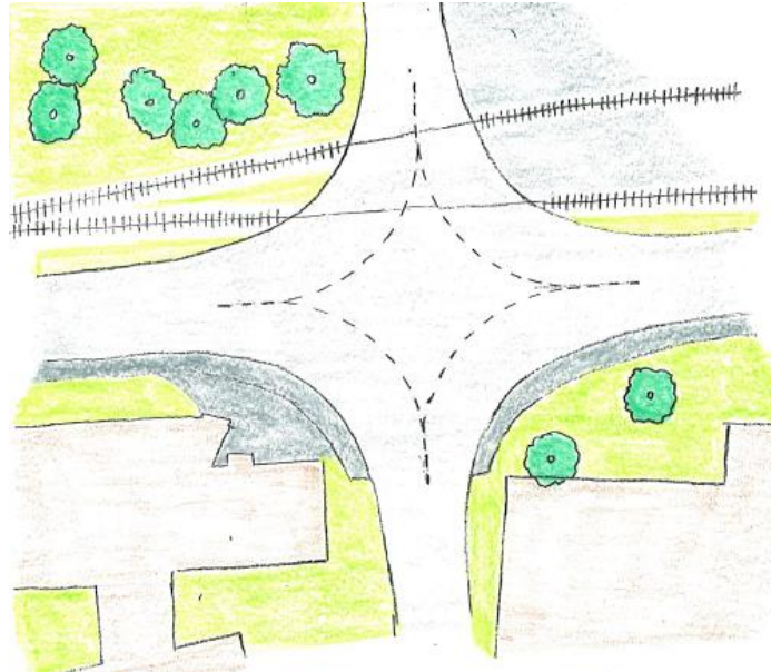
Lösung Knoten Rupperswilerweg / Fabrikstrasse