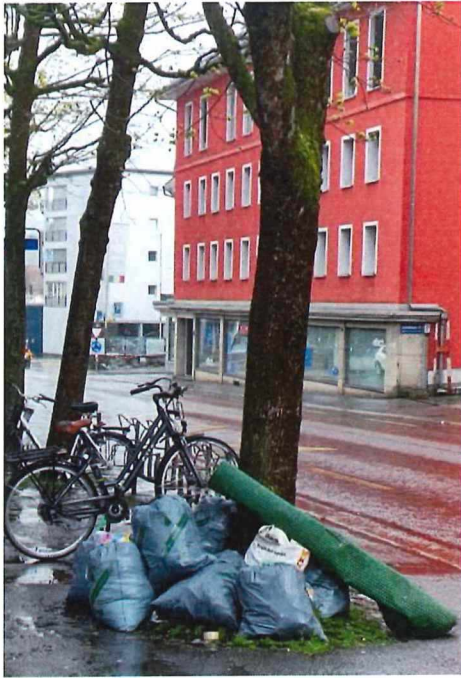
MANOR, Dienstag, 31.03.2026