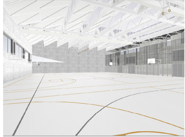
Abbildung 2: Innansicht Halle