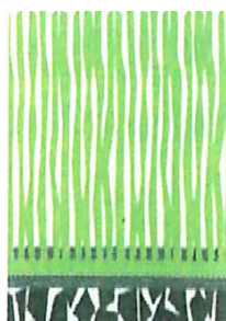
Abb. 1: Unverfüllter Kunststoffrasen

In den Medien konnten in letzter Zeit Informationen über die gesundheitsschädigende Wirkung von Kunstrasen entnommen werden. Beim bestehenden und beim neuen Kunstrasen in der Bernau besteht jedoch keine Gefahr. Die Problematik der Gesundheitsgefährdung besteht vor allem im Zusammenhang mit granulatverfüllten Rasen. Beim unverfüllten Rasen sind die Granulatflocken in einer Elastikschiicht gebunden und durch ein Bindeharz gefestigt. Diese Schicht befindet sich vollständig unter dem Rasenteppich. Dadurch können keine gesundheits- oder umweltschädigenden Stoffe austreten.