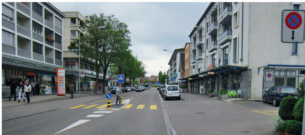
Die Landstrasse soll zur Flaniermeile und zum Treffpunkt werden.