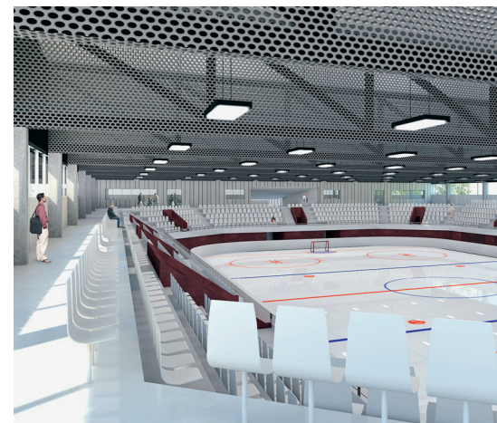
Eishalle und Aussenansicht (unten).

terung des bestehenden Angebots wird das «tägi» dank seiner Mehrzwecknutzung auch in Zukunft Aushängeschild für Wettingen und die ganze Region sein.