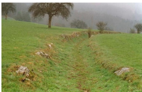
Lättengässli Juli 1992

Der Weg ist teils als einseitiger Hangweg (Bergseite) und teils als Hohlweg ausgeprägt. Die Böschungen (Lockermaterial) sind bis zu 2 m hoch und die historische, ursprüngliche Wegbreite beträgt ca. 4 m. Um den historischen Weg zu schützen und ihn wieder begehbar zu machen, wurde dieser schützend saniert. Von einem massiven Ausbau kann jedoch nicht gesprochen werden. Die Ausbaubreite beträgt ca. 1.40 m.