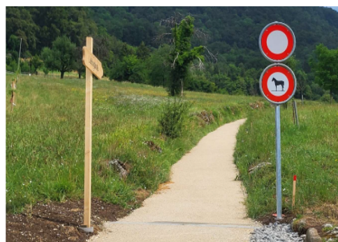
Lättengässli nach Sanierung 2023