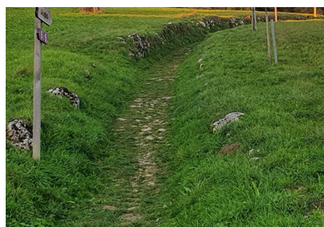
Lättengässli Herbst 2022