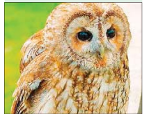
Würenlos. Bei der Abendwanderung «Waldvögel», konzentriert sich einmal alles aufs «Hören».