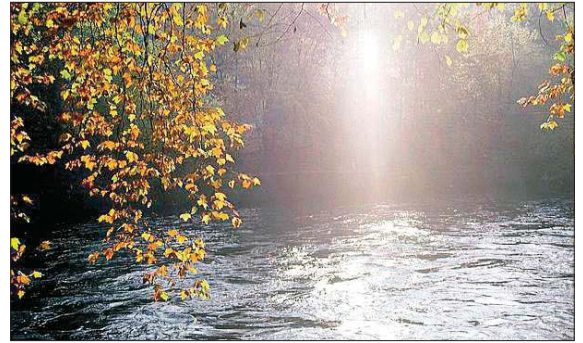
Thema «an der Limmat» von Dieter Hartmann, Wettingen