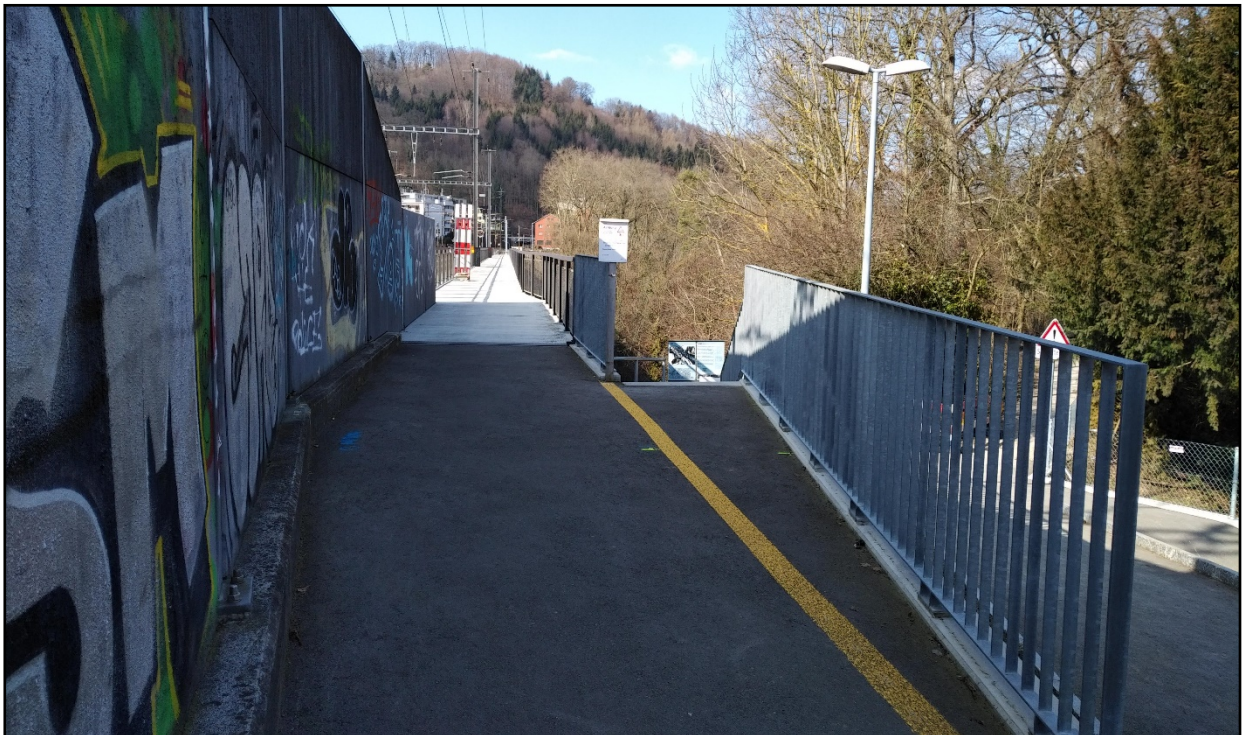
Neue Stahlkonstruktion mit verbreitertem Weg und Vorlandsteg

Die Verbreiterung der Schwimmbadstrassenbrücke erfolgte durch den Teilabbruch und die Verbreiterung der Betonfahrbahn. Weiter wurde eine neue Absturzsicherung - angepasst an die neue Situation - erstellt.