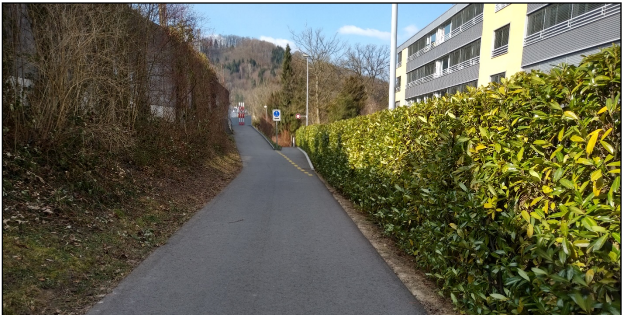
Zufahrtsweg von Seite Wettingen

Die obgenannten Arbeiten wurden wie geplant ausgeführt.