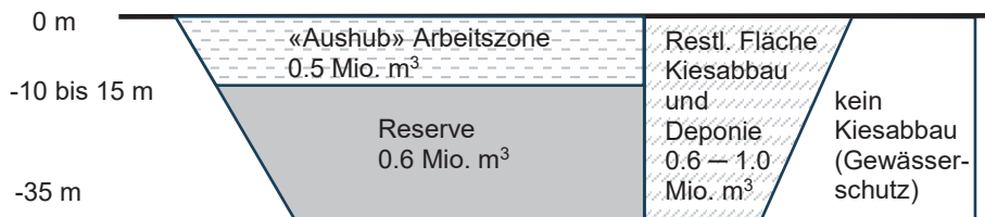
Abbildung 2: Parzellen 789 und 3271, «Aushub» Arbeitszone (Phase 1) ca. 0.5 Mio. m 3 , darunterliegende Reserve ca. 0.6 Mio. m 3 , restliche Fläche ca. 0.6 Mio. bis 1.0 Mio. m 3 , kein Kiesabbau im Bereich des Gewässerschutzbereichs

Bei einem allfälligen zukünftigen Rückbau der Arbeitszone kann die Reserve abgebaut werden und das Gesamtvolumen (Aushub Arbeitszone und Reserve) als Deponie für sauberen Aushub genutzt werden. Im östlichen Teil im Bereich des Gewässerschutzbereichs ist kein Kiesabbau vorgesehen.