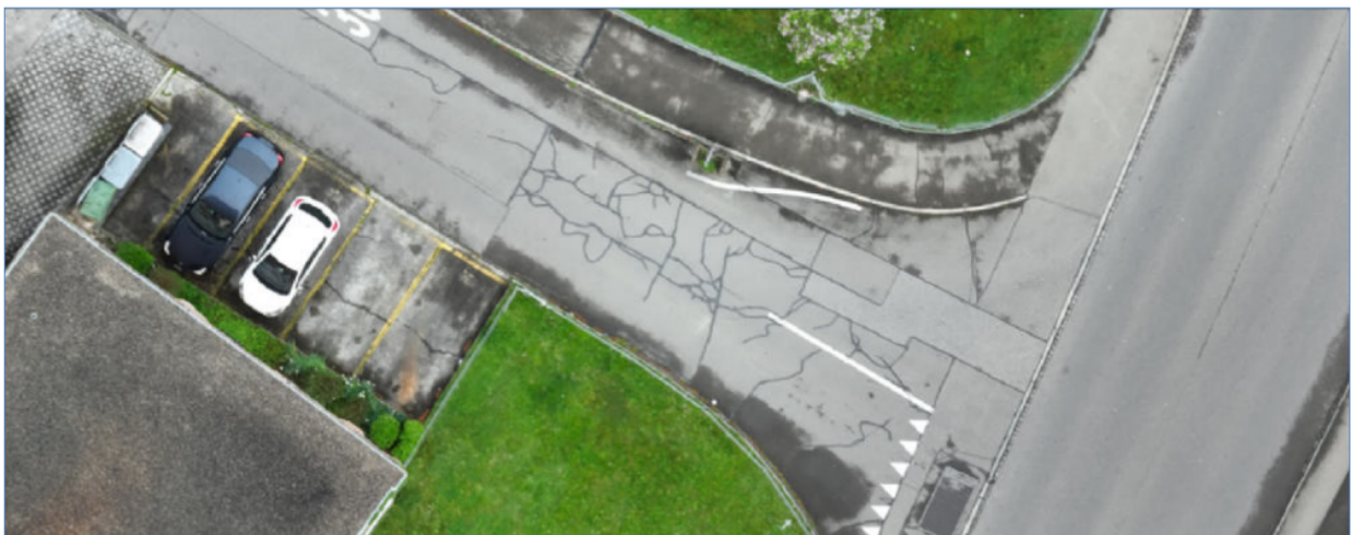
Abb. 2: Luftbild Kreuzungsbereich Jurastrasse - Hardstrasse

Der Strassenoberbau ist in einem schlechten baulichen Zustand. Die Strasse weist viele Flicke und Schäden wie Netzrisse, wilde Risse, Belagsrandrisse und Ausmagerungen auf.