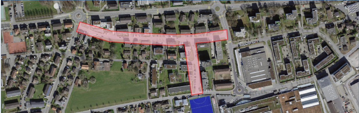
Abb. 1: Projektperimeter

Der Bauprojektperimeter umfasst die Hardstrasse im Abschnitt Bahnhofstrasse bis Jurastrasse und den kompletten Ahornweg.