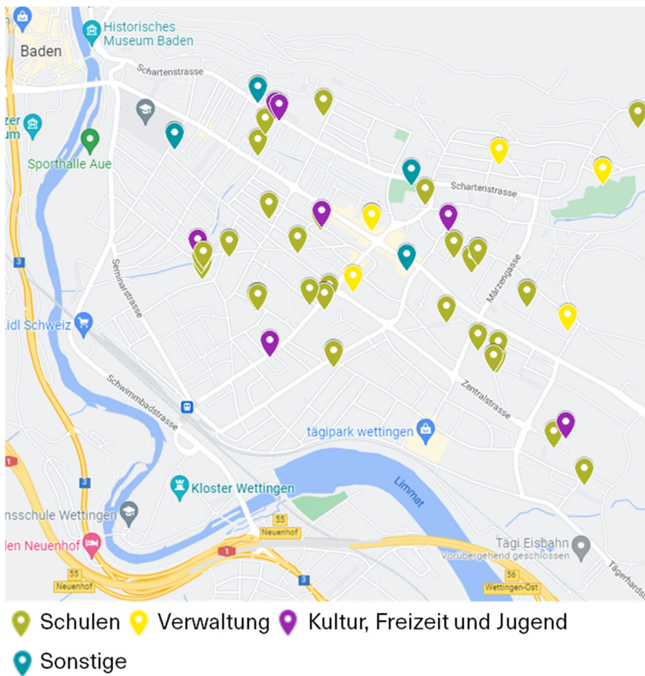
Abbildung 3: Standorte Verwaltungsgebäude

Das Immobilienportfolio hat einen Gebäudeversicherungswert von knapp CHF 244.5 Mio. und umfasst 57 Gebäude. Die Standorte sind in der untenstehenden Abbildung 3 eingezeichnet. Zum grössten Teil werden die Liegenschaften für schulische Zwecke (Schulen und Kindergarten) genutzt.