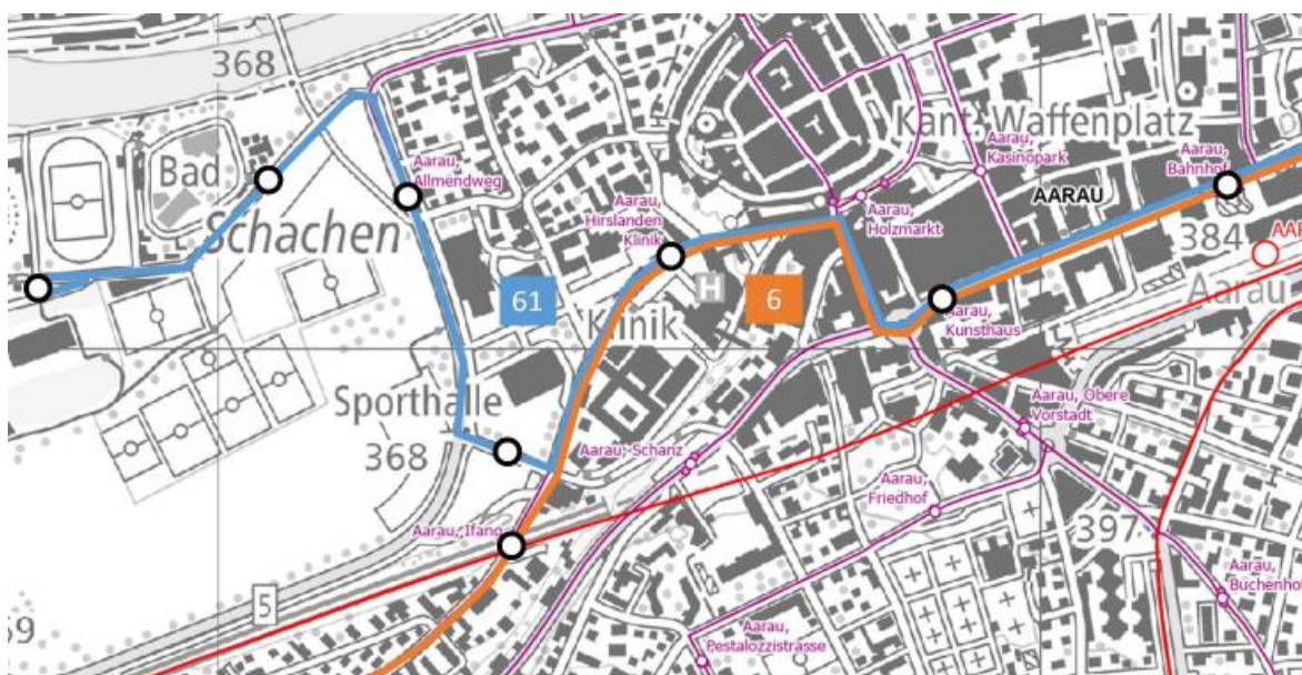
Abbildung 2: mögliche Linienführung Linie 61 und Linie 6

Die technischen und baulichen Abklärungen bzgl. Ziegelrain und Bushaltestellen werden 2025 erfolgen. Aufgrund der genannten Umstände ist eine allfällige Realisierung der dargestellten Linie 61 und die geänderte Linienführung der Linie 6 (Abbildung 2) nicht auf Fahrplanwechsel im Dezember 2025 möglich. Um die Taktverdichtung zwischen Bahnhof Aarau und dem Kantonsspital nicht weiter zu verzögern, soll diese von der Taktverdichtung und direkten Linienführung im Gebiet Schachen/Damm losgelöst werden. Die Taktverdichtung Bahnhof Aarau - Kantonsspital soll wie beantragt auf den Fahrplanwechsel im Dezember 2025 erfolgen, die noch offenen Fragen für den dargestellten Ast Bahnhof Aarau - Schachen/Damm werden parallel dazu vorangetrieben. Je nach Ergebnis der Prüfung wird dem Einwohnerrat zu einem späteren Zeitpunkt eine Vorlage zur entsprechenden Taktverdichtung und geänderten Linienführung Schachen/Damm vorgelegt.