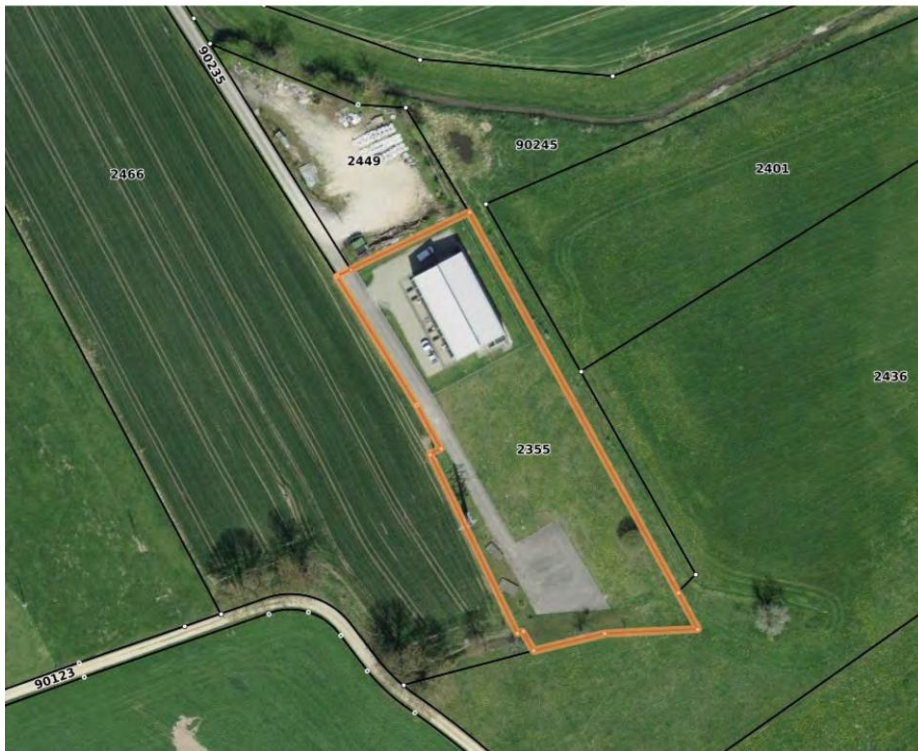
Abbildung 2: Flächenbedarf UW Kappel 2400m 2