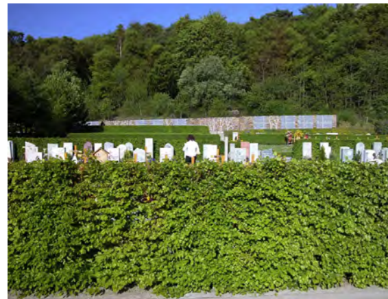
Visualisierung Projektidee, Verlängerung nach Süden