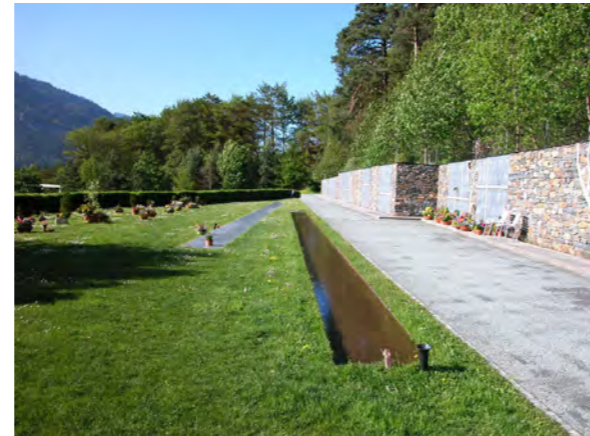
Visualisierung Projektidee, Verlängerung nach Norden