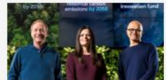
Microsoft will mehr CO2 aus der Atmosphäre entfernen als ausstoßen: Negative CO2-Bilanz soll 2030 erreicht werden >