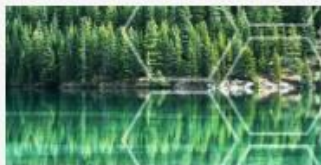
„Erde an KI...!“ – Mit Künstlicher Intelligenz zu neuen Ideen für unseren Planeten >