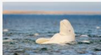
Kegelrobben und Belugawale: Microsoft KI hilft in Alaska beim Artenschutz >