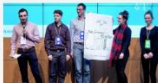
Das war das EarthLab! >