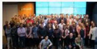
Microsoft Earth Lab: Zwei Tage, 50 Experten und 42 innovative Ideen für unseren Planeten >