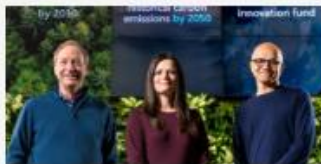
Microsoft will 2030 mehr CO2 aus der Atmosphäre entfernen als produzieren >

Im Januar haben wir Microsofts Klima-Initiative ins Leben gerufen und uns als Unternehmen neue Ziele gesteckt, um bis zum Ende dieses Jahrzehnts CO2-negativ zu werden. Auch wenn sich der berufliche und private Alltag für uns alle durch die weltweite Corona-Krise grundlegend verändert hat, sind Nachhaltigkeitsfragen nicht weniger dringend oder wichtig geworden. Aus diesem Grund kündigen wir heute den zweiten Schritt unserer Nachhaltigkeitsbemühungen für 2030 an, mit denen wir den Schwerpunkt auf die Erhaltung und den Schutz der Artenvielfalt und der Gesundheit der Ökosysteme unseres Planeten legen.