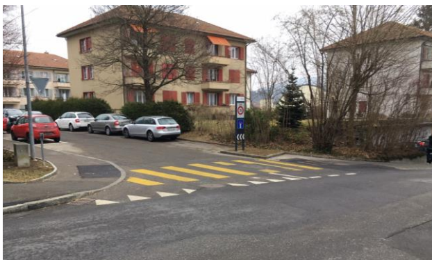
Abb. 2 Zelgweg bisher

An verkehrsorientierten Strassen mit signalisierten Geschwindigkeiten > 30 km/h eignen sich Trottoirüberfahrten, um die Sicherheit für zu Fuss Gehende im Bereich von einmündenden Strassen zu erhöhen. Auf Trottoirüberfahrten sind die zu Fuss Gehenden vortrittsberechtigt. An der Wahlackerstrasse wurden entsprechende Anpassungen bei den Einmündungen von Lüfterweg und Schmittestützli bereits realisiert. Ausstehend sind Trottoirüberfahrten bei der Einmündung Zelgweg (heute Fussgängerstreifen) und dem Zugang zum Friedhof (heute Vortritt zu Gunsten der Strassenbenutzenden). Bei den Einmündungen Hessweg, Lindenweg und der Zufahrt zur Einstellhalle Häberlimatte sind Trottoirüberfahrten angedeutet. Die Gestaltung entspricht aber weder den Normen noch den anderen bereits erstellten Trottoirüberfahrten in der Gemeinde Zollikofen. Die Trottoirüberfahrten sind ein gutes Mittel, um die Schulwegsicherheit zusätzlich zu verbessern.