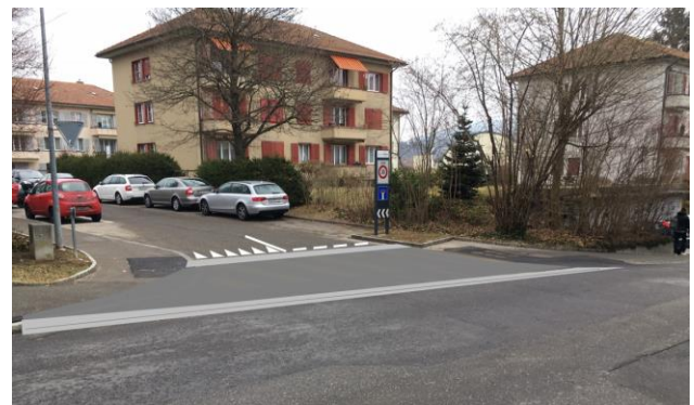
Abb. 3 Zelgweg mit Trottoirüberfahrt