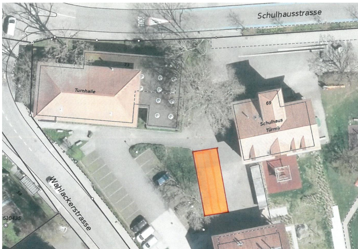
Situationsplan mit Standort der Container für die Schulbibliothek