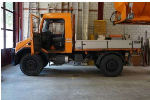
Unimog U90 Jg. 1999

Im Jahre 1999 schaffte die Gemeinde Zollikofen für den Werkhof einen Mercedes Unimog U90 an. Zur damaligen Zeit war der Unimog U90 bei den Gemeinde-Werkhöfen ein gefragtes Fahrzeug. Alternative Kommunalfahrzeuge mit multifunktionalen Eigenschaften, wie sie der Markt heute bietet, waren damals selten und wenig erprobt.