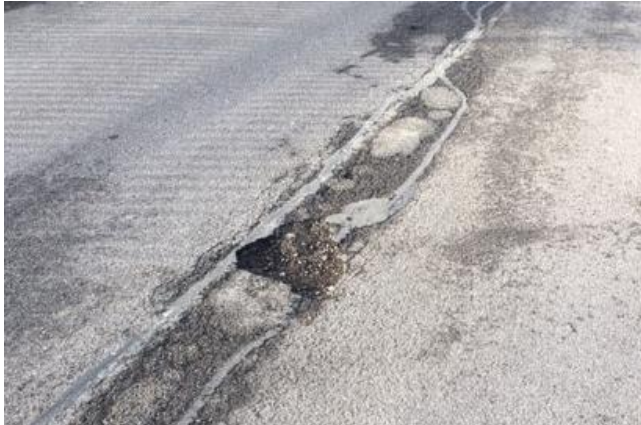
Abb. 2 Belagsausbrüche

anschliessend ein neuer Deckbelag eingebaut. Zudem zeichnet sich ein Ersatz der fünf Einlaufschächte (Strassenentwässerung) ab. Für den ursprünglich geplanten Realisierungszeitpunkt ist eine Belagssanierung sicher angezeigt. Im Moment ist der Strassenzustand im Sanierungsperimeter mehrheitlich genügend aber auf kleinen Abschnitten bereits schlecht. Eine Belagssanierung kann mit kleineren Reparaturen (Kaltbelagsflicken, Rissanierung und Teilersatz) bis zum vorgesehenen Sanierungszeitpunkt im Jahr 2026 hinausgezögert werden. Weil sich drei der fünf Einlaufschächte der Strassenentwässerung im Grabenbereich von Wasser und Fernwärme befinden, sollen diese bereits mitsaniert werden. Die Tiefbaukosten für die Sanierung der Einlaufschächte betragen Fr. 12'000.00.