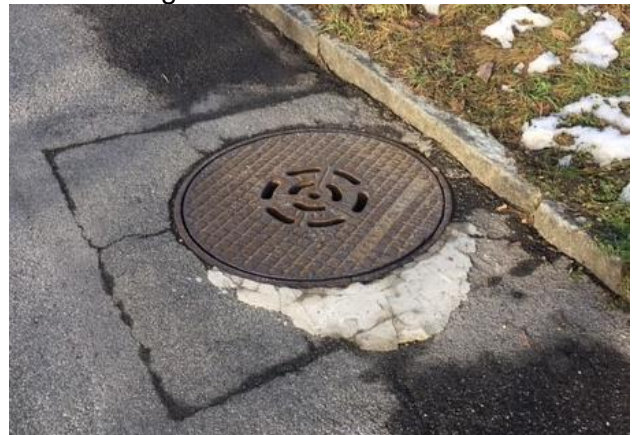
Abb. 5 Schachtdeckel mit Reparaturstelle