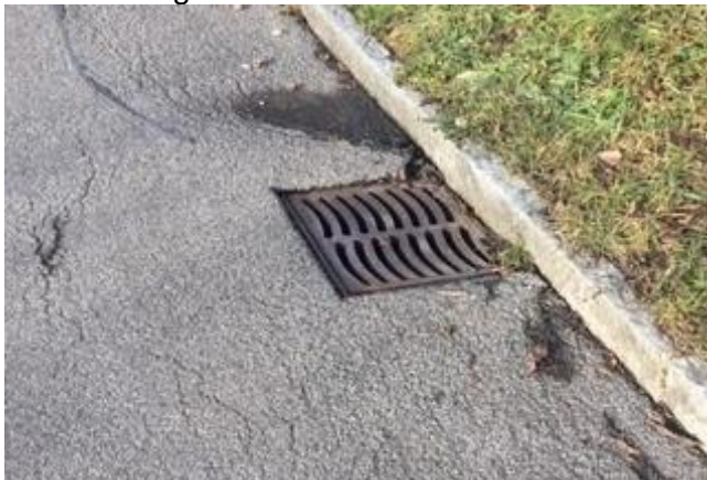
Abb. 4 Senkungen bei Einlaufschächten