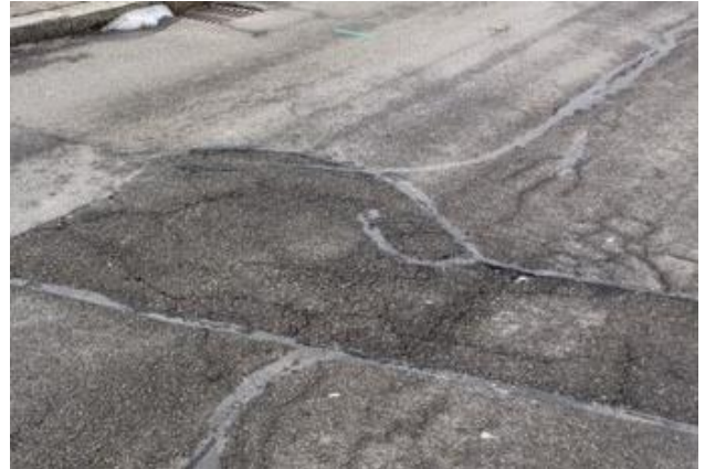
Abb. 3 Belagsrisse