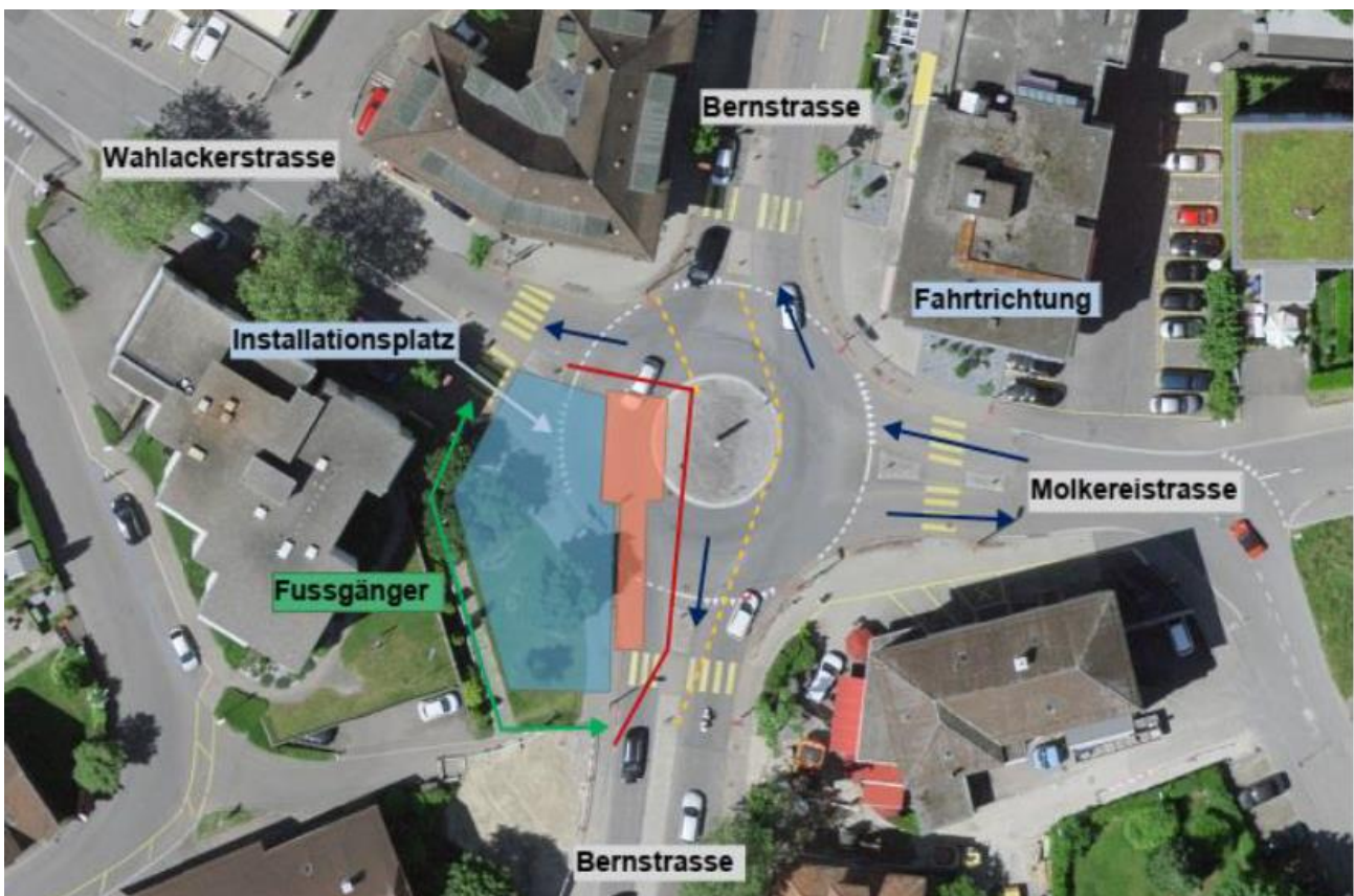
Abb.2 Verkehrskonzept Bernstrasse

Durch die notwendigen Massnahmen an den Schächten und Leitungen in der Bernstrasse (Teilprojekt 1) wird der Verkehr stark eingeschränkt. Zur Gewährleistung eines möglichst raschen und sicheren Bauablaufs muss ein Abschnitt des Kreisels Unterzollikofen komplett gesperrt werden. Das hat zur Folge, dass während dieser Phase die Einfahrt in die Bernstrasse von der Wahlackerstrasse nicht möglich sein wird und dadurch die Verkehrsbelastung auf der Reichenbachstrasse und der Schulhausstrasse zunehmen wird. Die Arbeiten sind während der Sommerferien geplant, dann, wenn das Verkehrsaufkommen erfahrungsgemäss am geringsten ist. Das Verkehrskonzept ist mit dem für die Kantonsstrasse zuständigen Strasseninspektorat Bern Mittelland West und dem RBS abgesprochen. Im gleichen Zeitraum setzt der RBS infolge des Gleisunterhalts und des Umbaus des Bahnhofs Bern einen Bahnersatz für die Linie S9 ein, der mit zwei Bussen die Strecke Worblaufen-Hirzenfeld bedient. Während der Arbeiten im Kreisel Unterzollikofen ist geplant, dass der Bahnersatz ausschliesslich die Route Unterzollikofen-Kreuz-Hirzenfeld und retour mit provisorischen Haltestellen bei der Sekundarschule und beim Coop (gegenüber der Haltestelle Kreuz beim Denner) bedient.