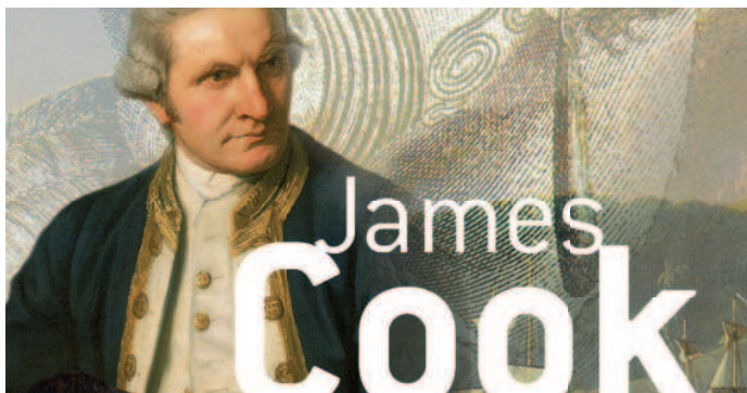
JAMES COOK UND DIE ENTDECKUNG DER SÜDSEE

Das Historische Museum Bern lädt ein zu einem Blick hinter die Kulissen der entstehenden Grossausstellung «James Cook und die Entdeckung der Südsee» (7.10.2010–13.2.2011).