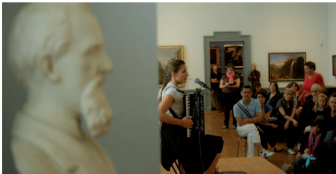
MUSEMÜNTSCHI 2009 IM KUNSTMUSEUM BERN

Führungen, Kinderprogramm, Performances, Prominente aus Politik und Kultur auf der Bühne, Kulinarisches ... Eintritt frei