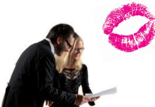
«BLICKEN SIE UNS ÜBER DIE SCHULTER!»

Mit persönlicher Einführung durch das BSO-Team Kultur-Casino Bern, Eintritt frei